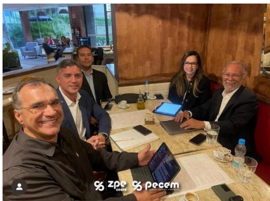
Reunião com ABRAZPE

Delegação Chinesa da Província de Gansu e da Embaixadora da República Tcheca, interessados em conhecer e trocar experiências e conhecimentos com a ZPE Cearense.