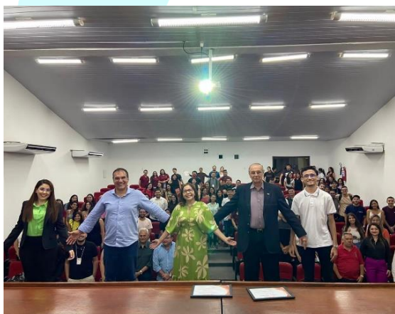
Semana de Contabilidade da Universidade do Vale do Acaraú

A participação em seminários e workshops e a aproximação com a academia e entidades de classe, através de reuniões e apresentações, também possibilitou difundir o regime ZPE e suas vantagens competitivas. Em 2023, a ZPE Ceará esteve presente na Semana de Contabilidade da Universidade do Vale do Acaraú – UVA.