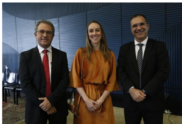
Reunião com MDIC e CZPE

Outra ação institucional relevante em 2023 foi a missão realizada para visitas às Zonas Francas na Cidade do Panamá no Panamá, Cartagena e Bogotá na Colômbia. Por meio destas visitas in loco foi possível vivenciar as experiências das diferentes Zonas Francas desses países e conhecer detalhes da aplicação dos regimes na América Latina. Na ocasião, a Diretoria Executiva também participou do 1º Encontro Latino-Americano e do Caribe de Parques Eco-Industriais promovido pela Embaixada da Suíça em parceria com a Associação de Zonas Francas da Iberoamerica – AZFA.