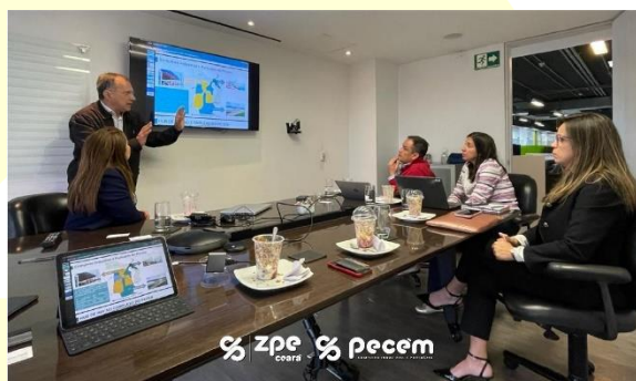
Missão Panamá e Colômbia

Com objetivo de compartilhar experiências, criar oportunidades para ampliar a competitividade e participar de treinamentos, capacitações, qualificações e palestras a ZPE Ceará, em 2023, filiou-se à Associação das Empresas do Complexo Industrial e Portuário do Pecém - AECIPP. A filiação possibilitou a participação nos Fóruns Temáticos da Associação que promovem o fortalecimento e desenvolvimento mais integrado do Complexo do Pecém.