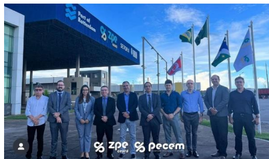
Reunião com representantes da Receita Federal

Durante o mês de novembro realizou-se o encontro com as demais ZPE's brasileiras, que contou com a participação de 4 (quatro) ZPE's nacionais e teve como objetivo trocar experiências e informações.