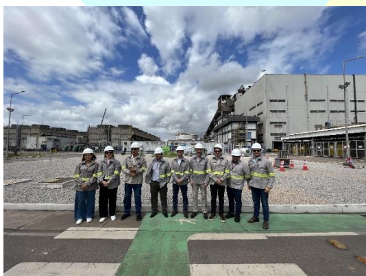
Encontro com representantes de ZPE's Brasileiras