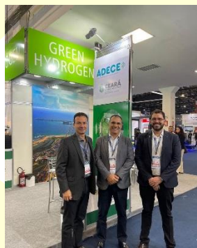
World Hydrogen 2023