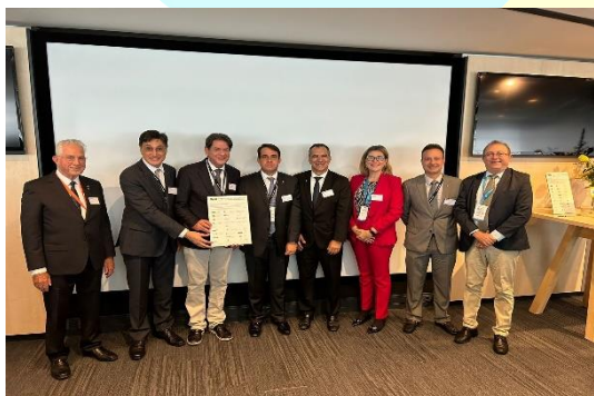
World Hydrogen 2023