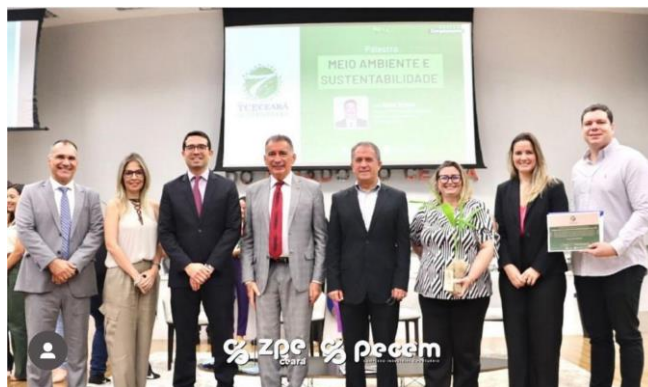
Entrega do Selo TCE Sustentável